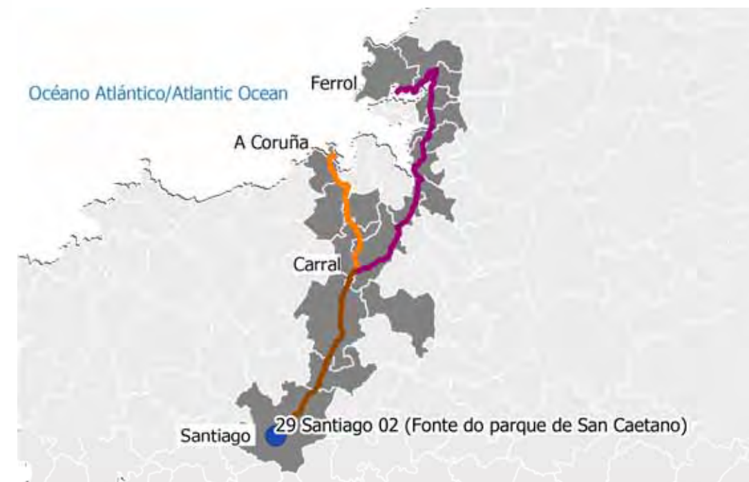
Escala/scale 1:1.000.000 (A3)

LIFE16 ENV/ES/000533 "CREATING A NEW CONCEPT OF NATURAL DRINKING FOUNTAINS AND DEMONSTRATING ITS VIABILITY ALONG ST JAMES' WAY"