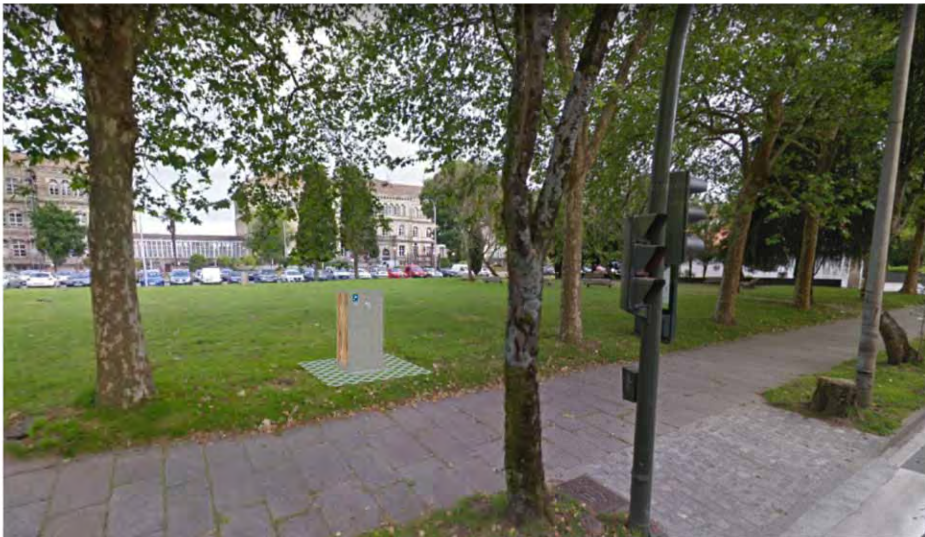
Infografía de la solución propuesta / Infographic of the proposed solution