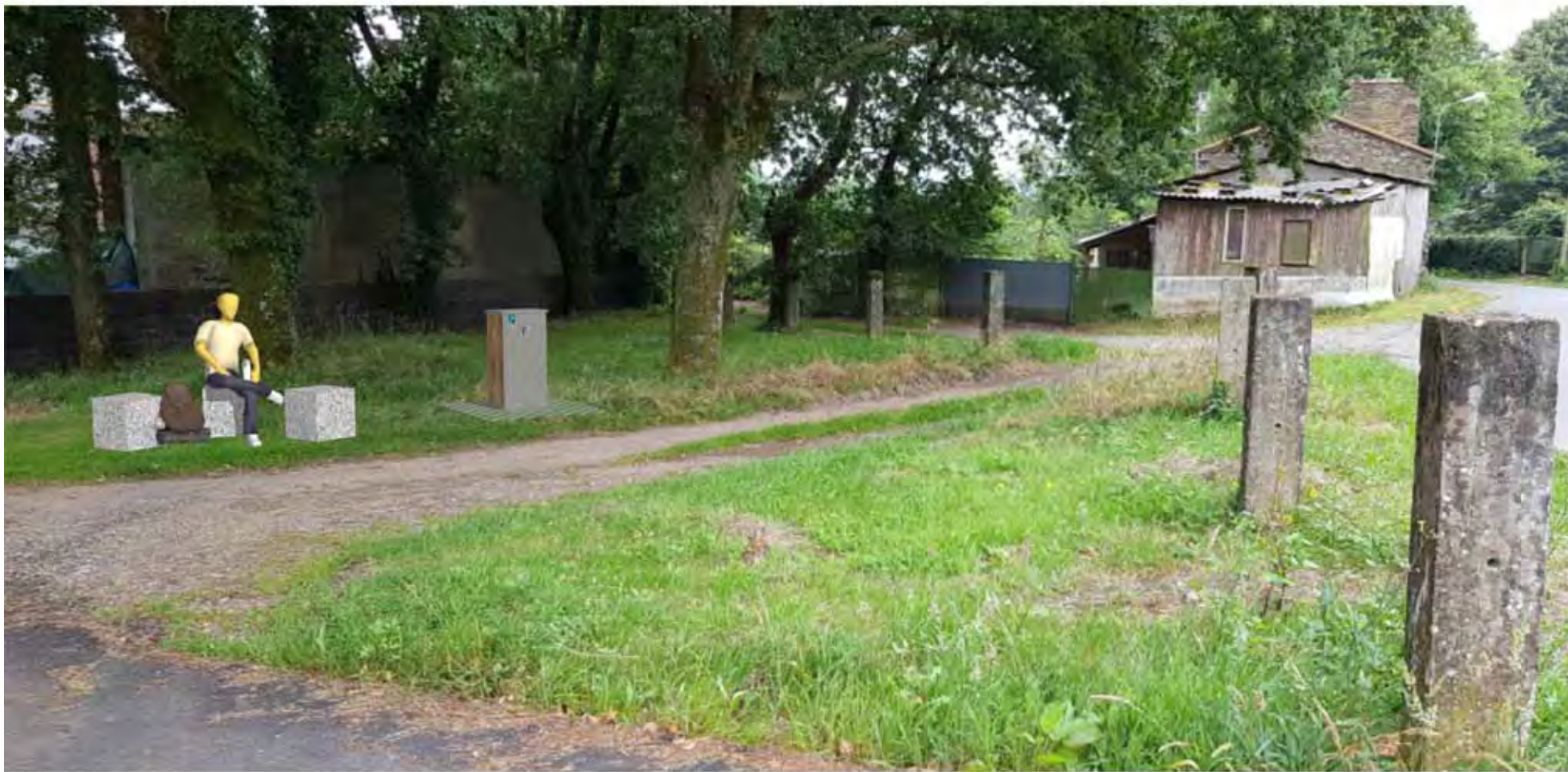
Infografía de la solución propuesta / Infographic of the proposed solution