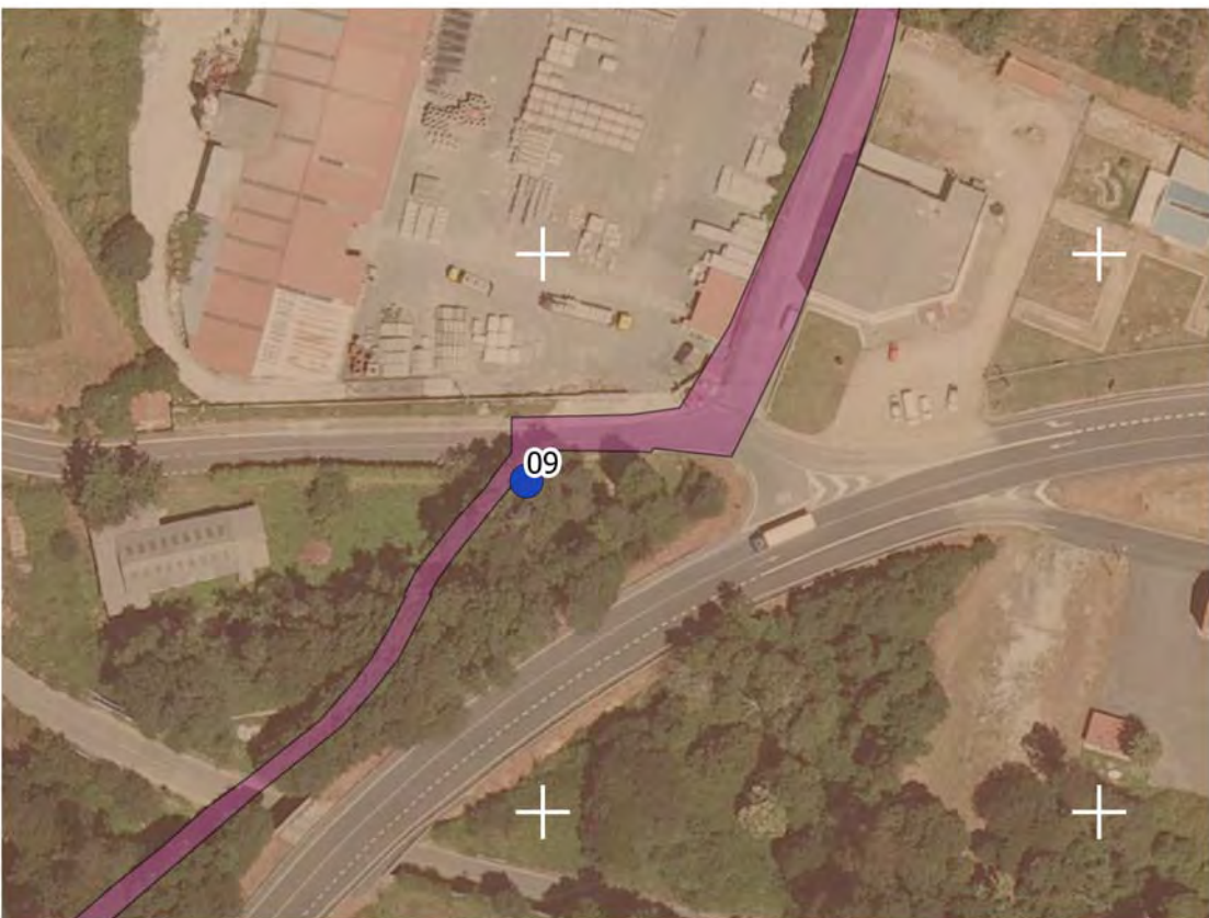
Escala/scale 1:1.500 (A3) Sistema de referencia UTM/UTM reference system. Datum ETRS 89 huso 29 / zone 29N