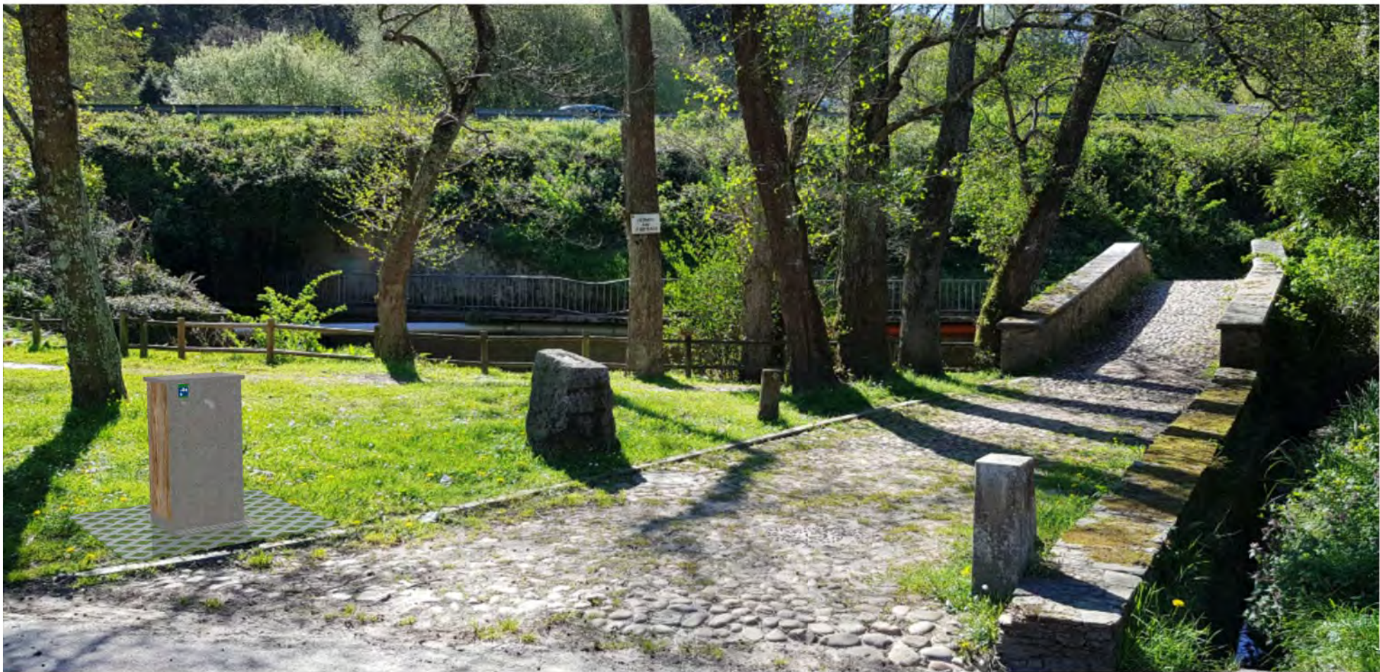
Infografía de la solución propuesta / Infographic of the proposed solution