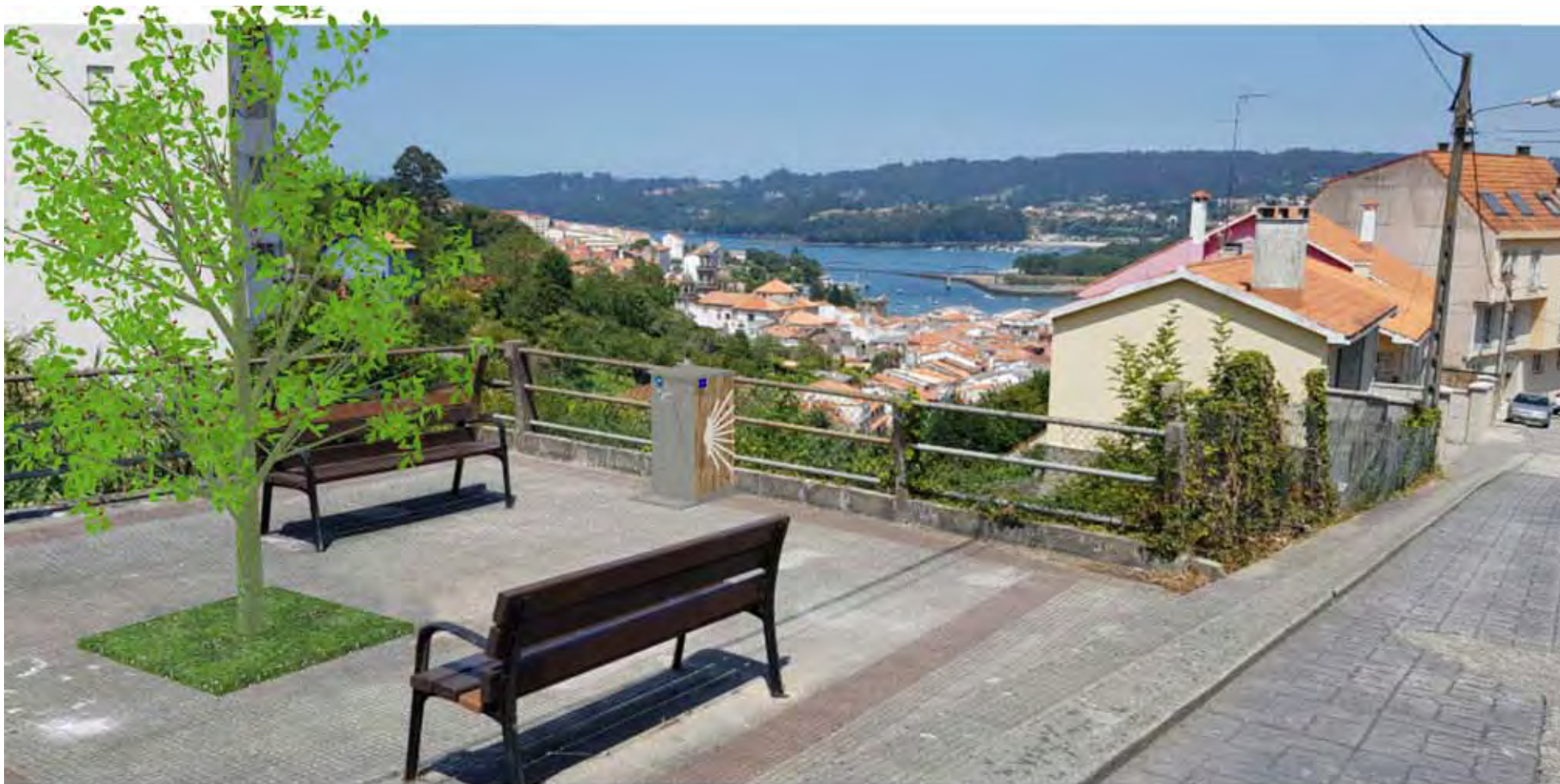
Infografía de la solución propuesta / Infographic of the proposed solution