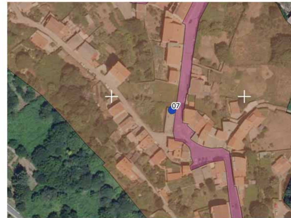
Escala/scale 1:1.500 (A3) Sistema de referencia UTM/UTM reference system. Datum ETRS 89 huso 29 / zone 29N