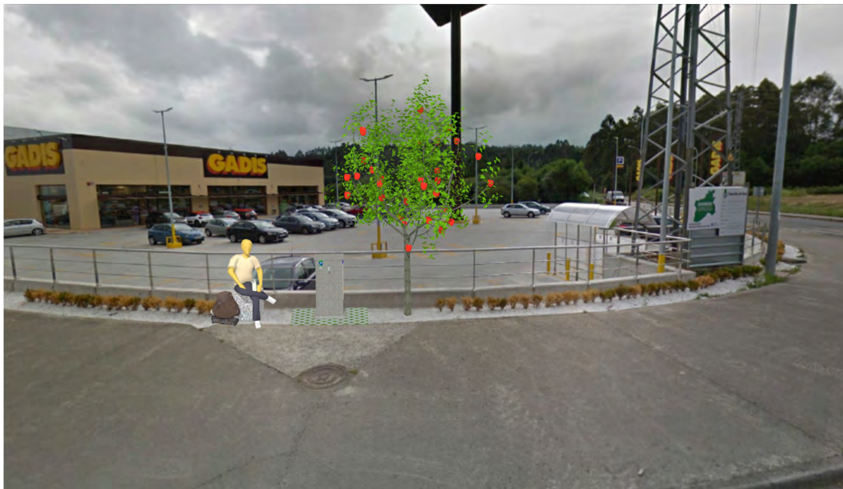
Infografía de la solución propuesta / Infographic of the proposed solution