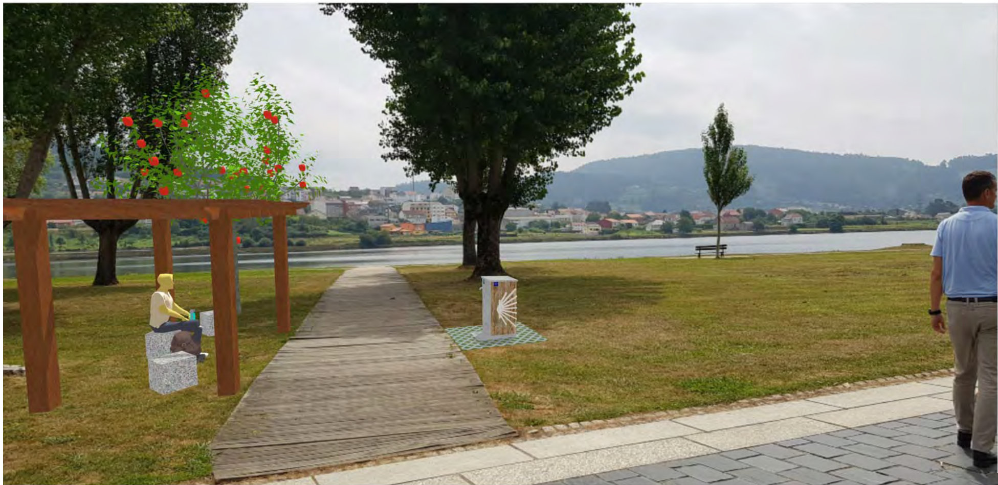
Infografía de la solución propuesta / Infographic of the proposed solution